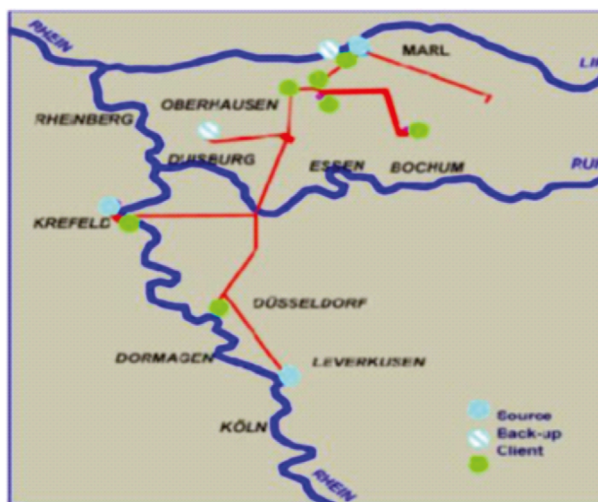
Rys. 2. System gazociągów wodorowych w Zagłębiu Rury

Niestety rozwój infrastruktury wodorowej jest powolny. Hamuje go brak potrzeby (czyli ciągle zbyt niski popyt), a ceny wodoru dla konsumentów końcowych są wysoce zależne od liczby tankowań. Łączna długość gazociągów wodorowych w Europie to około 1500 km. Na-