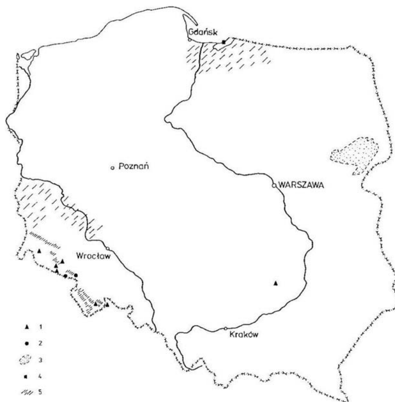
Rys. 2. Obszary perspektywiczne dla poszukiwań rud uranu w Polsce 1 – wyeksploatowane rudy uranu (w złożach samodzielnych, jako kopaliny współwystępującej i towarzyszącej), 2 – złoża ubogich rud uranu, 3 – obszar występowania uranonośnych łupków dictyonemowych, 4 – wystąpienie rud uranu w piaskowcach triasowych, 5 – obszary perspektywiczne dla poszukiwań złóż uranu